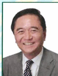
演者 神奈川県知事 黒岩 祐治