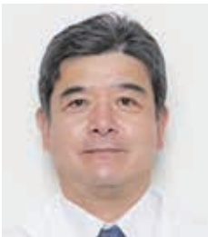
久下 亨 Toru Hisaka

1990年 久留米大学医学部卒業 1994年 久留米大学医学部外科学助教 2001年 NIH 留学 2015年 久留米大学医学部外科学講座准教授 2020年 久留米大学医学部外科学講座教授